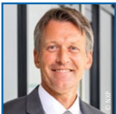
Lars Reger CEO, NXP Semiconductors Germany

13:45 Ende des ZVEI-Jahreskongresses 2022