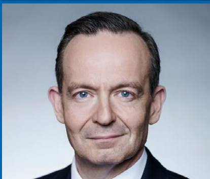
Dr. Volker Wissing Bundesminister für Digitales und Verkehr