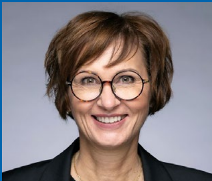
Bettina Stark-Watzinger Bundesministerin für Bildung und Forschung