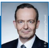
Dr. Volker Wissing Bundesminister für Digitales und Verkehr